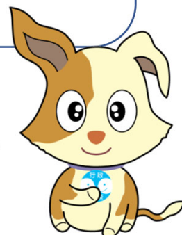
行政相談マスコット キクーン