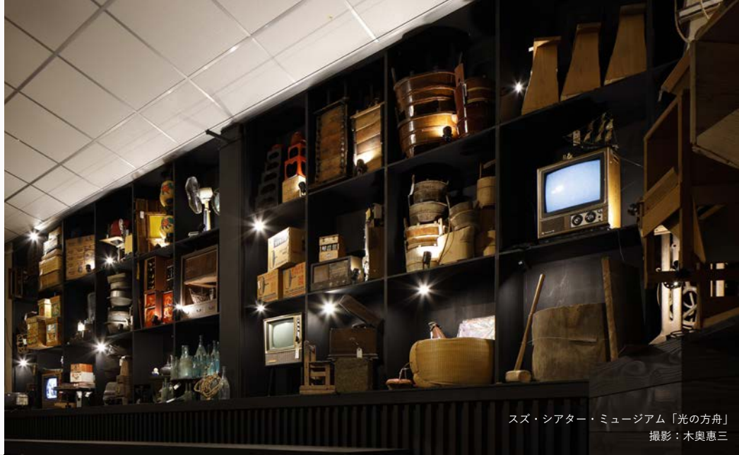
スズ・シアター・ミュージアム「光の方舟」

スズ・シアター・ミュージアムは、かつての珠洲市立西部小学校の体育館を全面改修し、珠洲市内の家々に眠っていた生活用具の数々を一堂に集め、アートの手法を用いて新たな命を吹き込み、他に類のない「モノが自ら語りだす」劇場型歴史民俗博物館として、2021年9月に誕生しました。