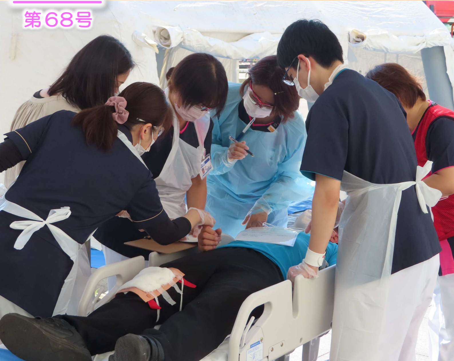
災害医療対策訓練(珠洲市総合病院)