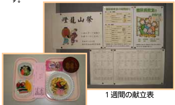
行事食（ひなまつり）

患者さんから『おいしかった。』と喜んでいただけるように、さらに研鑽をしていきたいと思っています。