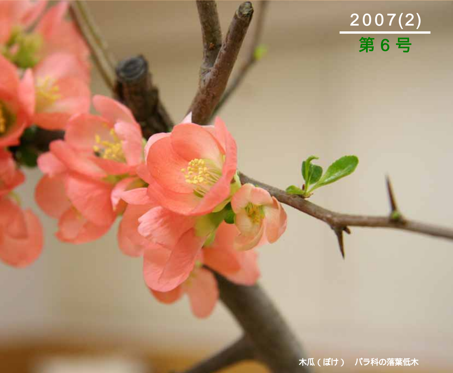
木瓜（ぼけ） バラ科の落葉低木