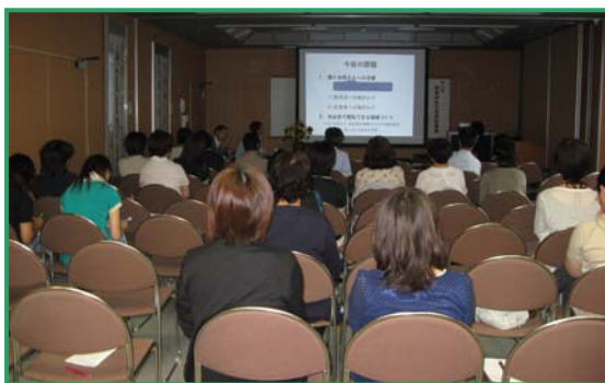
母乳育児特別講演の様子

母乳育児について見直されている今、能登北部が日本で誇れる母乳育児支援の先進地域となれるよう今後も努めていきます。