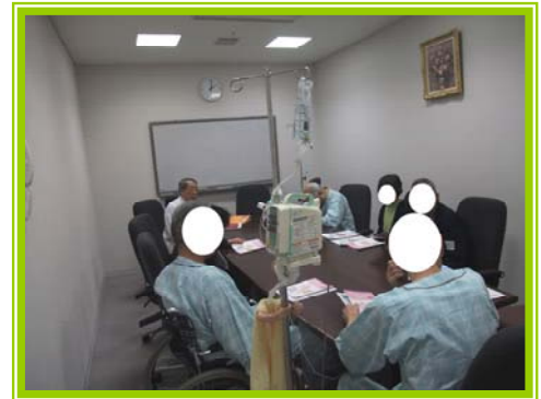
糖尿病予防教室の様子