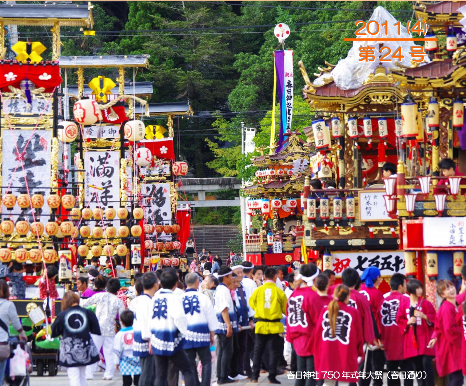
春日神社 750 年式年大祭 (春日通り)