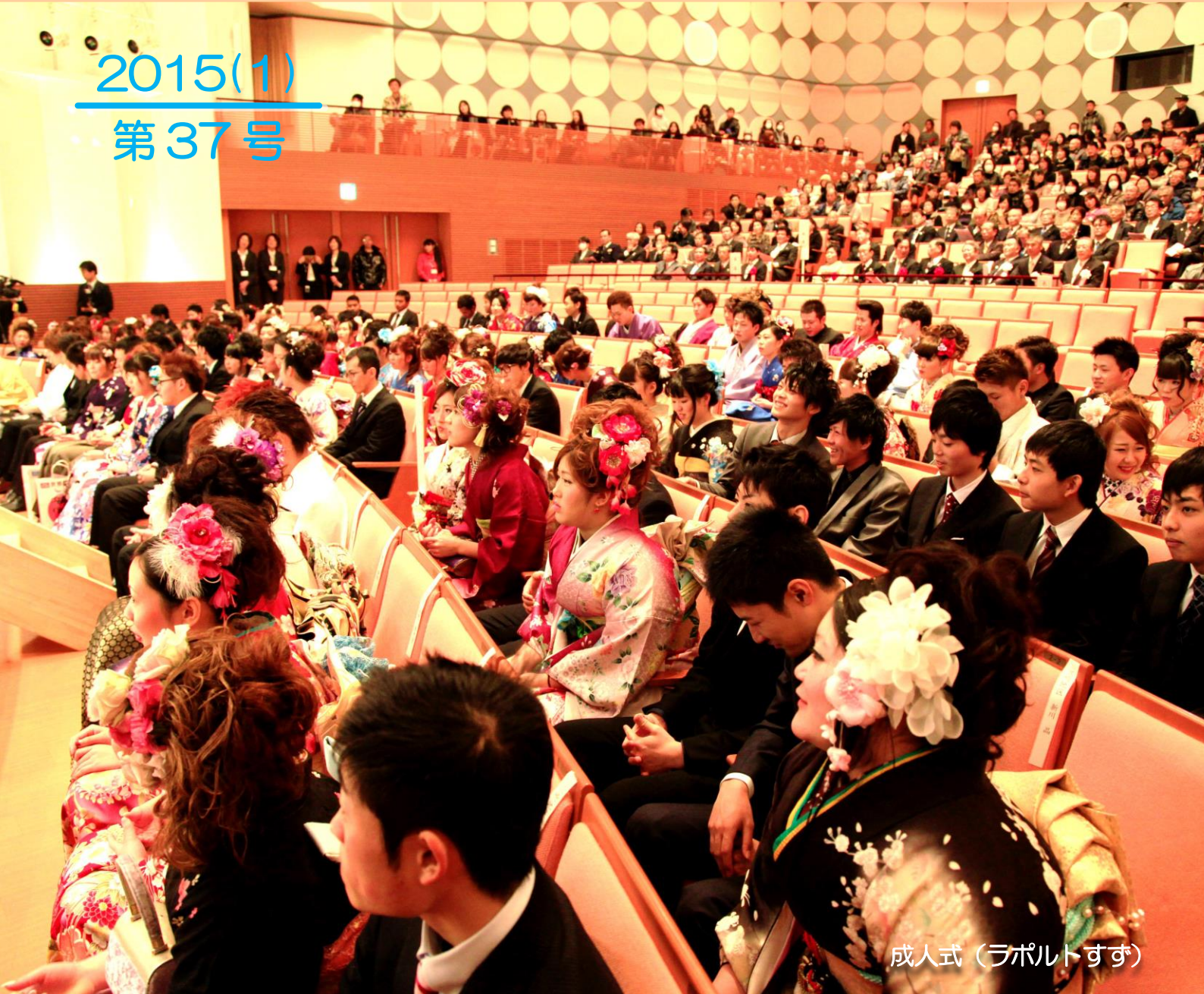
成人式（ラポルトすず）