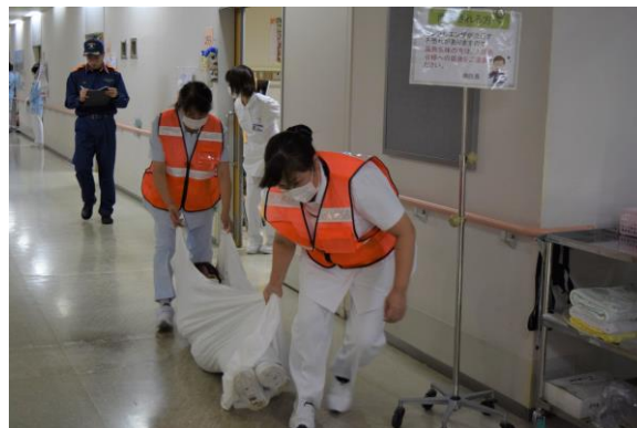
消防署員監督のもと、入院患者の避難誘導訓練を実施する職員

これからも災害拠点病院として常に防火意識を持ち、対応能力の向上を図る取り組みを継続して実施していきます。