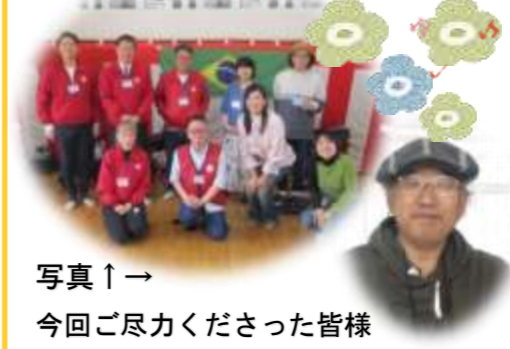
写真↑ 今回ご尽力くださった皆様

また会場では、美味しいお茶やコーヒー、ブラジル料理店「タカミフーズ」様のホットスナックもご用意くださり、最後には、富山県の献上銘菓「こし村百味堂」様の「千代くるみ」も配られ、心もお腹も満たされる特別なひとときとなりました。誠にありがとうございました。