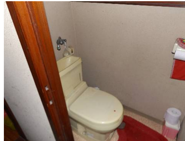
トイレは汲み取り式（簡易水洗）